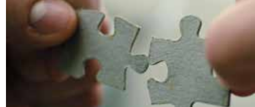
Integratie OCMW en gemeente p. 3