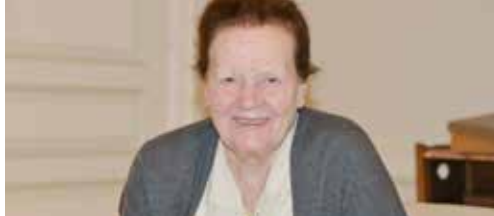
N-VA-lid in de kijker p. 2